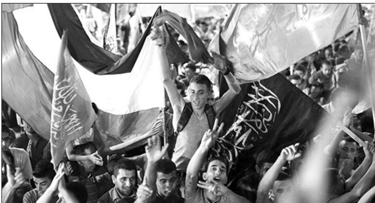
Festejos en Gaza tras el alto el fuego

En medio de la crisis de su gobierno, acepta un alto el fuego permanente que incluye la apertura del paso de Rafah, es decir, una atenuación importante del bloqueo. El paso de Rafah (que une a Gaza con Egipto, la única frontera que no controla directamente Israel), estará bajo el control de la Autoridad Nacional Palestina, que ahora tiene un gobierno unificado entre Al Fatah y Hamas (los dos partidos principales de Palestina, Al Fatah gobierna Cisjordania, y Hamas, Gaza). También se acepta que los pescadores de Gaza pesquen hasta 6 millas (en lugar de las 3 millas que tenían permitido hasta ahora). Esto, por cierto, no es la paz, ni la liberación del pueblo palestino, ni el fin de la cárcel de Gaza. Quedaron "en discusión" asuntos tales como el derecho de los palestinos a tener un puerto y un aeropuerto, y la liberación de 100 presos palestinos.