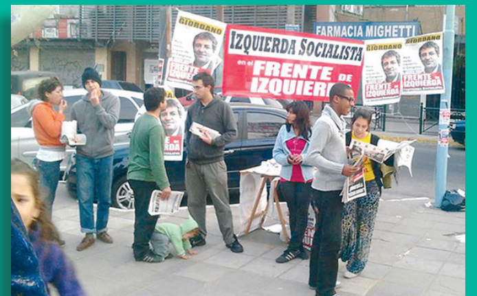
Militantes de nuestro partido ofreciendo El Socialista