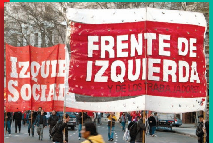
Marcha del 24 marzo junto al Frente de Izquierda