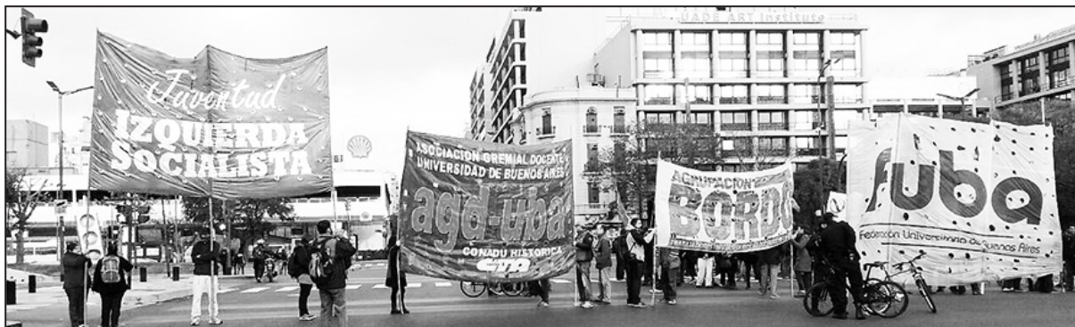
Estudiantes y docentes universitarios durante el paro del 28

Esta orientación del rectorado tiene una organización que la sostiene desde el claustro estudiantil y es la Franja Morada/Nuevo Espacio que actúa con completa connivencia y