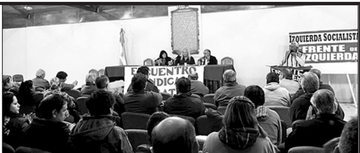
El salón de conferencias del sindicato municipal estuvo colmado de trabajadores y dirigentes que recibieron a Sobrero

Todos los trabajadores presentes se comprometieron a impulsar el paro general de este jueves contra el ajuste. Una mención aparte merecen los militantes de Izquierda Socialista de Tierra del Fuego, quienes se pusieron a disposición del Pollo en su estadía e hicieron todo lo posible para colaborar con el desarrollo de los distintos encuentros, dando pelea por la construcción de nuestro partido “en el fin del mundo”.