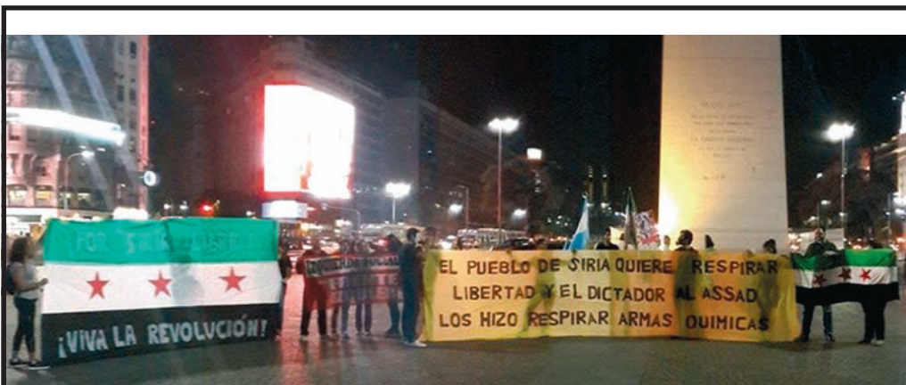
21 de agosto: jornada mundial de repudio a la masacre con armas químicas cometida hace un año por el dictador de Siria Bashar Al Assad. Izquierda Socialista fue parte, Obelisco de Buenos Aires.