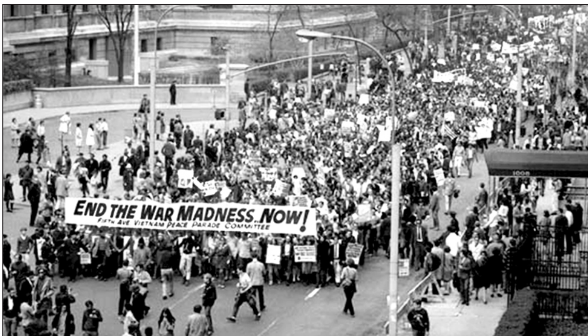
Durante años el pueblo norteamericano se manifestó en las calles contra la invasión a Vietnam

El movimiento antibélico en 1970 reunió a millones de manifestantes en la célebre "marcha sobre Washington", y siguió creciendo. En 1971 se produjo el escándalo de "los papeles del Pentágono". Gracias a las denuncias de Daniel Ellsberg, que había trabajado en la embajada yanqui en Saigón, se destapó una cantidad de irregularidades, informes falsos y operaciones encubiertas -nacidas en la Casa Blanca con los demócratas-, perpetradas por la CIA y las cúpulas militares. Así se supo que lo del Golfo de Tonkin había sido un montaje falso. Nixon y sus altos funcionarios mintieron e intentaron impedir que se hicieran públicas las denuncias. Luego intentaron atacar a Ellsberg robando su historia clínica a su psiquiatra. Todo esto, -un anticipo de los actuales célebres "wikileaks"-, fue desclasificado y confirmado en 2011. Para aspirar a